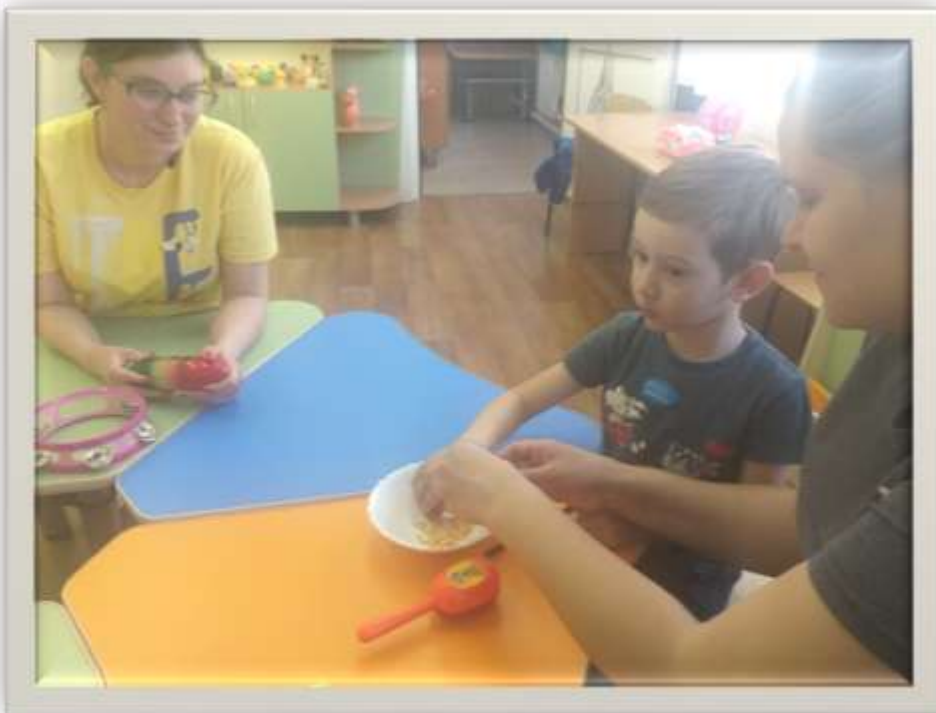
Мастер-класс для родителей по изготовлению мини-маракаса